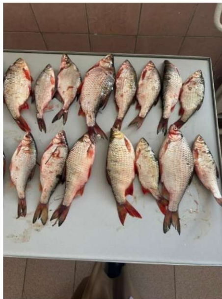
Сурет 1 – Балықтың ішкі мүшелерін паразитологиялық зерттеу

Паразитологиялық зерттеу кешенді классикалық әдістер арқылы жүргізілді, онда морфологиялық және микроскопиялық тәсілдер біріктірілді. Сыртқы беткі қабат (тері, желбезек, қанатшалар) және ішкі ағзалар (асқазан, ішек, бауыр, жүрек) зерттеліп, паразиттер бөлініп алынды (1-сурет).