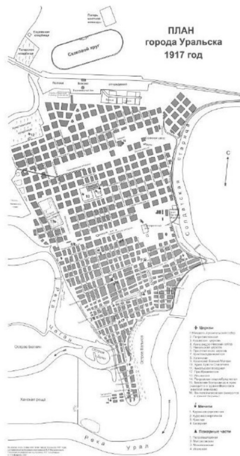
Рисунок 2 - План города Уральск (XX вв.)