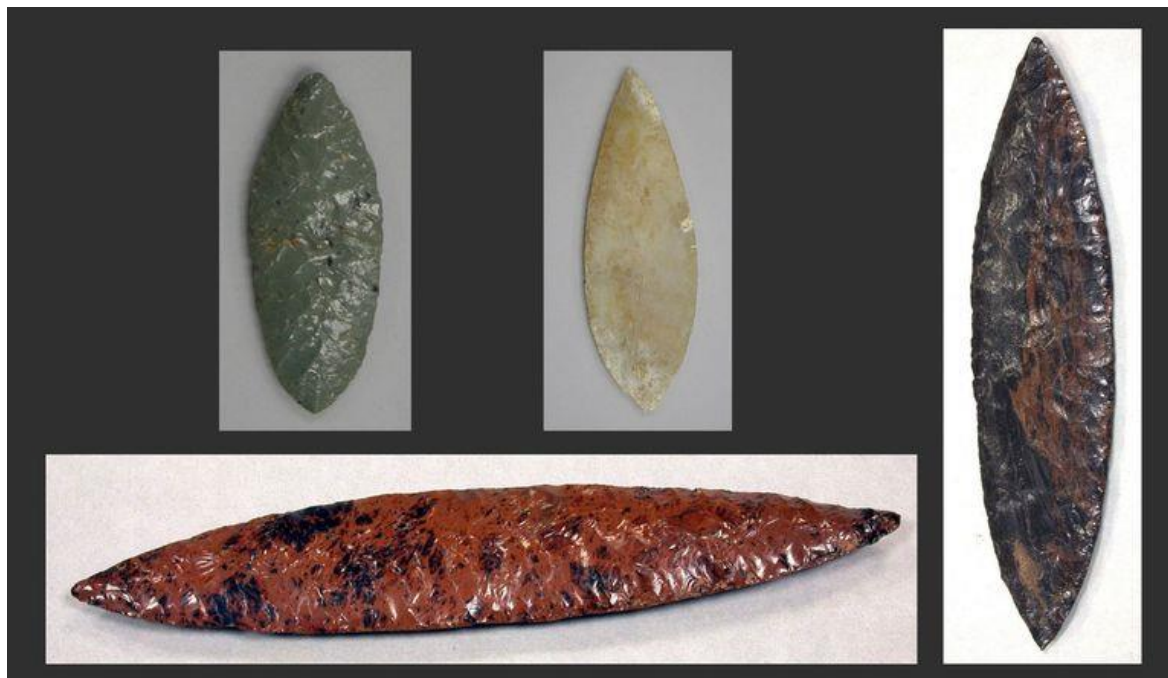
Рисунок 2 – Лезвия из обсидиана.

Помимо палицы и копья, в качестве орудия прорыва все чаще стали использоваться орудия, очень напоминавшие европейские алебарды. В качестве лезвия и острия, почти все народы использовали изделия из кремния или обсидиана.